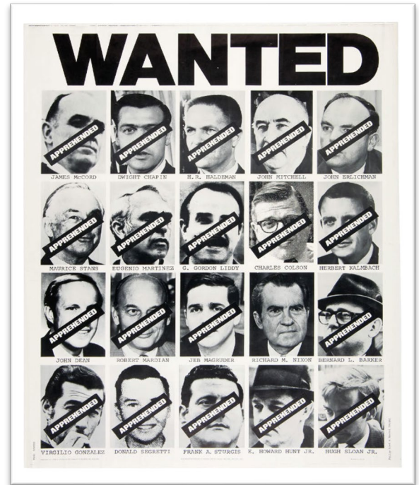
Cartel de “Se busca” de los conspiradores de Watergate

Aunque el presidente Nixon inicialmente dijo que los ayudantes de la Casa Blanca no recibirían permiso de testificar gracias al privilegio ejecutivo , el comité contraatacó, argumentando que el privilegio ejecutivo no se aplicaba a información sobre presuntos crímenes. Al final, el presidente no pudo prevenir que sus ayudantes testificaran.